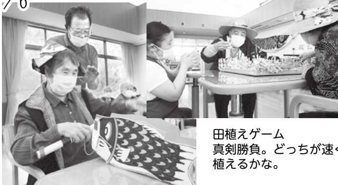
田植えゲーム 真剣勝負。どっちが速く植えるかな。