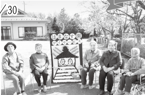
はまなす美人集合！