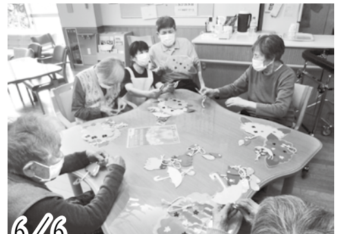
ショートステイでの飾り作り。季節に合わせた飾りを制作。紫陽花やカタツムリといった梅雨時に合わせた飾りを制作しました。