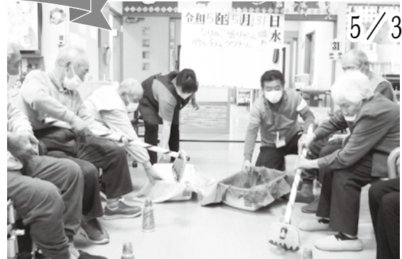
はまなす名物たけのこ掘り、皆さんの元気に病気も退散