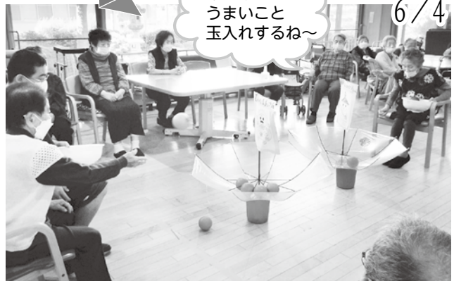
少しずつですが、感染対策を継続しながら、対面でのゲームを増やし、楽しんでいます。やっぱりハッスルし盛り上がるのは、チーム対抗の玉入れ合戦ですね！！