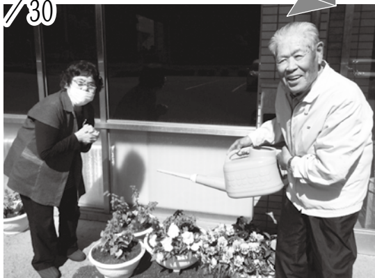
デイサービス玄関前で、花植えをしました。笑顔の花がいっぱい咲きますように。